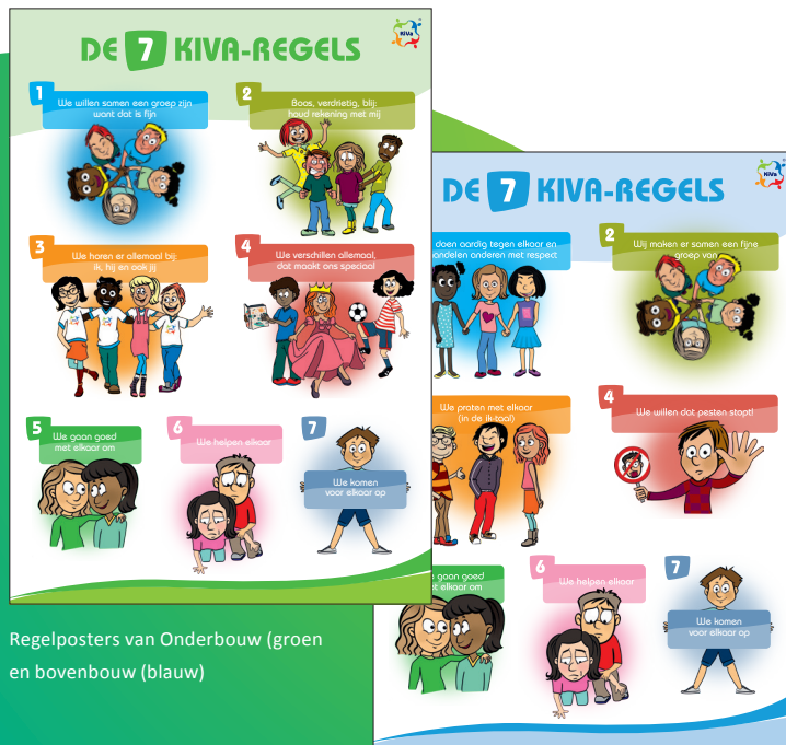
Regelposters van Onderbouw (groen) en bovenbouw (blauw)

Bij KiVa geloven we in de kracht van de groep. Bij het bedenken van goede ideeën, of het organiseren van leuke dingen, maar ook bij het oplossen en voorkomen van problemen in de groep wordt de nadruk gelegd op de verantwoordelijkheid die alle kinderen hebben voor het welzijn in de groep. Iedereen is (mede-)verantwoordelijk voor de sfeer in de groep. Hoewel niet iedereen verantwoordelijk is voor het ontstaan van een probleem, kan wel iedereen iets doen om te werken aan de oplossing. De kracht van de groep wordt ingezet voor gedragsverandering. Dit sluit aan bij de theorie van rolbenadering 1 . Door middel van KiVa leren kinderen strategieën die ze in kunnen zetten om problemen in de groep op te lossen en belangrijker nog om ze te voorkomen. Daarbij is het uitgangspunt dat iedereen (leerkrachten, leerlingen en ouders) sterke kanten heeft, die kunnen bijdragen aan een positieve sfeer. Kortom samen verantwoordelijk voor een fijne groep.